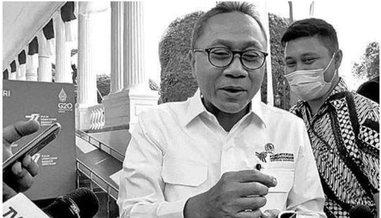
贸易部长基菲(Zulkifli Hasan)在雅加达声明,鸡蛋价格在未来两周之内将恢复正常。

两个方面,分别是中央政府公务员的义务达到935万亿盾和地方政府公务员的义务达到1990万亿盾。 伊萨说:“这是与国家公务员和军警退休金纲领的实施有关的中央和地方政府的估计款数。” 在另一方面,财政部部长穆丽亚妮(Sri Mulyani Indrawati)于8月24日在雅加达国会大厦同国会十一委员会举行工作会议时曾说过,由于加重了国家财政的负担,政府想将国家公务员的退休金方案,从现收现付改为全额资助方案,并认为退休金方面的改革变得非常重要。(Sm)