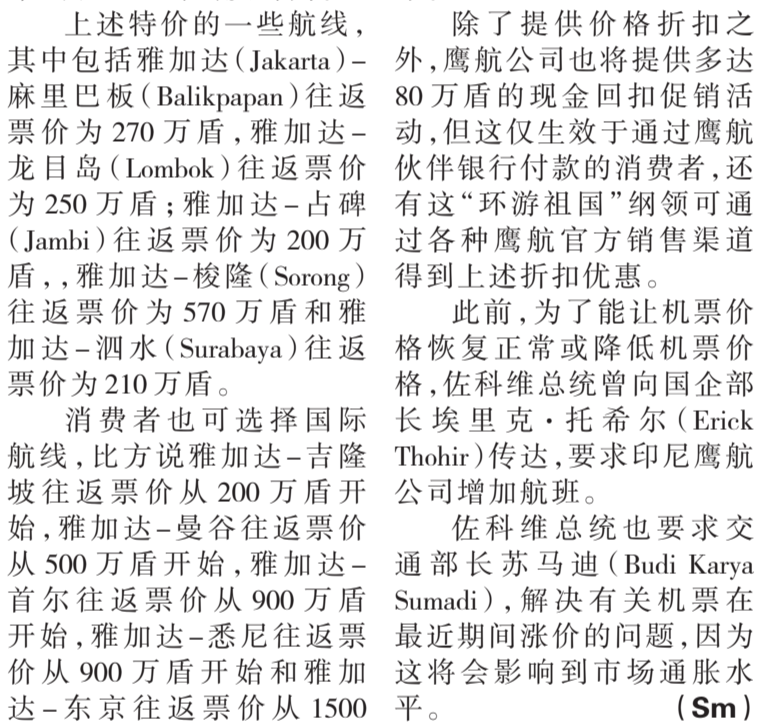
第二期雅京地铁建设预算膨胀

消费者也可选择国际航线,比方说雅加达-吉隆坡往返票价为200万盾开始,雅加达-曼谷往返票价为500万盾开始,雅加达-首尔往返票价为900万盾开始,雅加达-悉尼往返票价为900万盾开始和雅加达-东京往返票价为1500