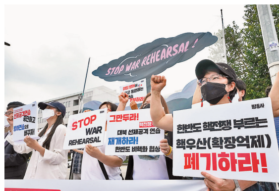
示威者抗議韓美聯合軍演。

韓美兩國軍隊22日正式啟動下半年「乙支自由之盾」聯合軍演，將持續至下月1日。韓國多個民間團體當天舉行集會，呼籲中斷韓美聯合軍演。