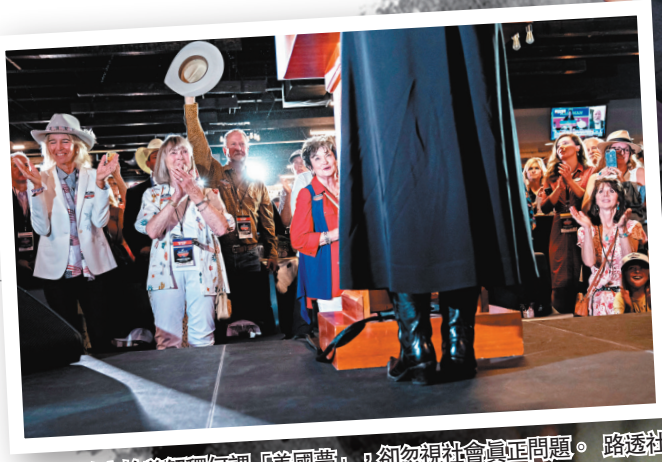
美國政客搶着解釋何謂「美國夢」，卻忽視社會真正問題。

里爾形容，共和黨人用「美國夢」當作「狗哨政治」策略，作為向支持者傳遞政治信息的手段。在坦內達爾看來，兩黨為「美國夢」定義陷入互相指責，卻無法解決真正的社會問題，形容「『美國夢』正逐漸變成一種幻覺。」