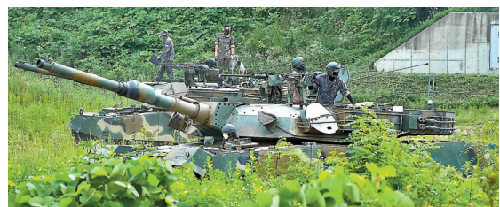
韓美啟動聯合軍演。圖為韓軍7月的演練。