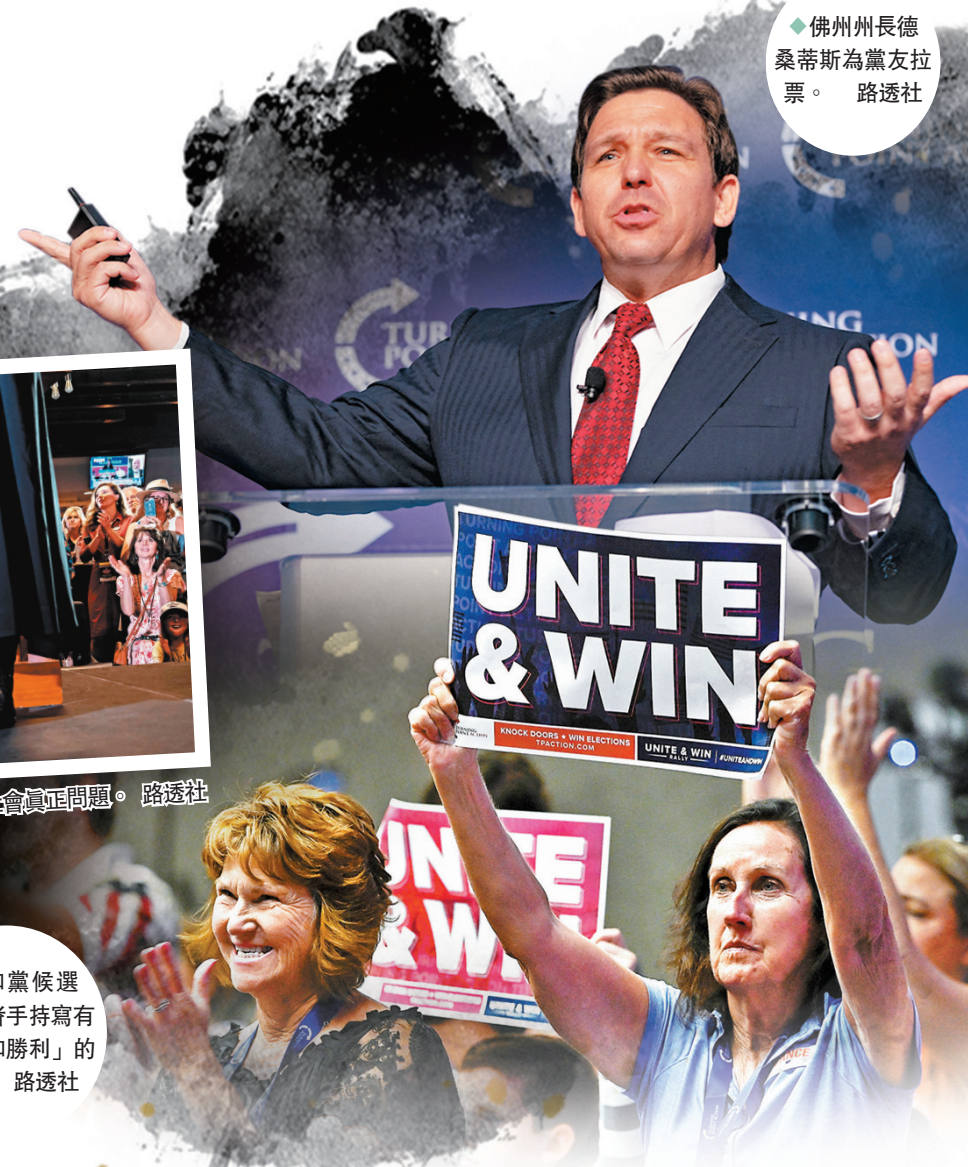
佛州州長德桑蒂斯為黨友拉票。