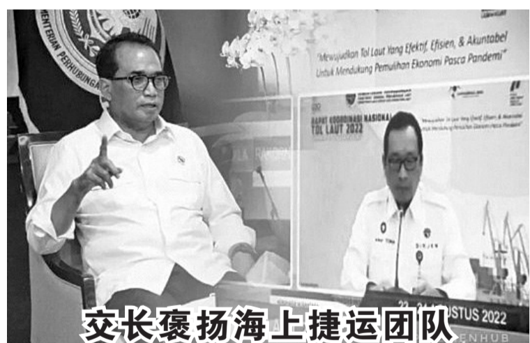
交长褒扬海上捷运团队 8月23日,交通部长苏马迪(左)通过线上方式召开海统筹会议时说,我国海上捷运发展得很好,尤其在协助经济复苏方面更是作出了一定的贡献。他也借这个机会褒扬海上捷运工作团队。