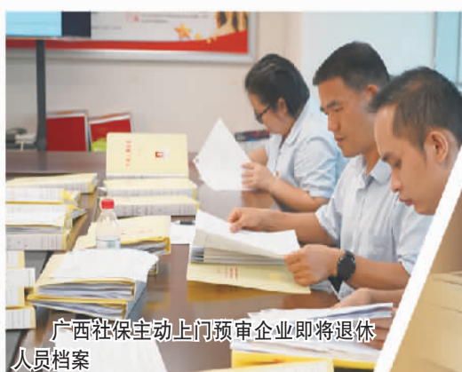
广西社保主动上门预审企业即将退休人员档案