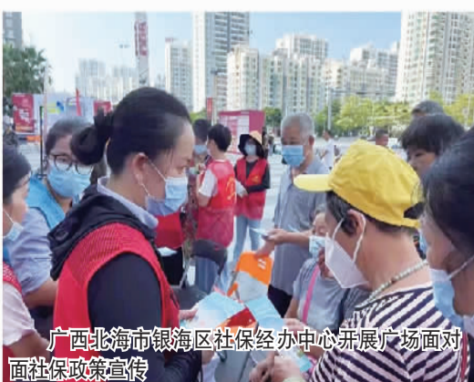
广西北海市银海区社保经办中心开展广场面对面社保政策宣传