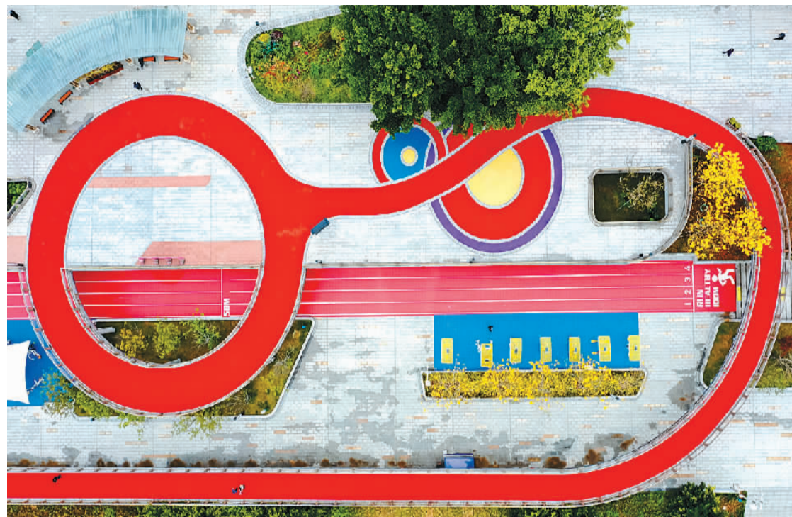
位于福建省福州市鼓楼区的西河智慧体育公园设有智能跑道、显示大屏等。

据悉，常青公园是武汉市第一座5G智慧公园。近几年，多地发力建设智慧公园，引入多样化的数字应用，让公园变得越来越“聪明”，也让游园更加便利和愉悦。