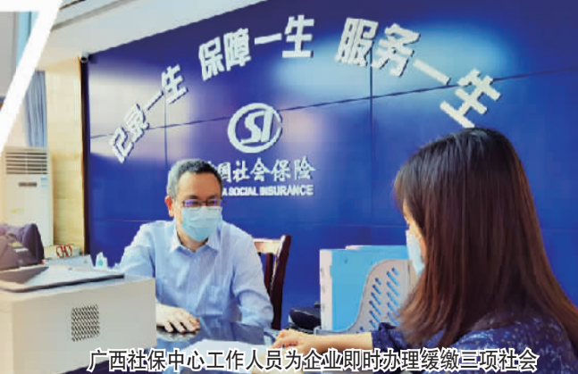
广西社保中心工作人员为企业即时办理缓缴三项社会保险费