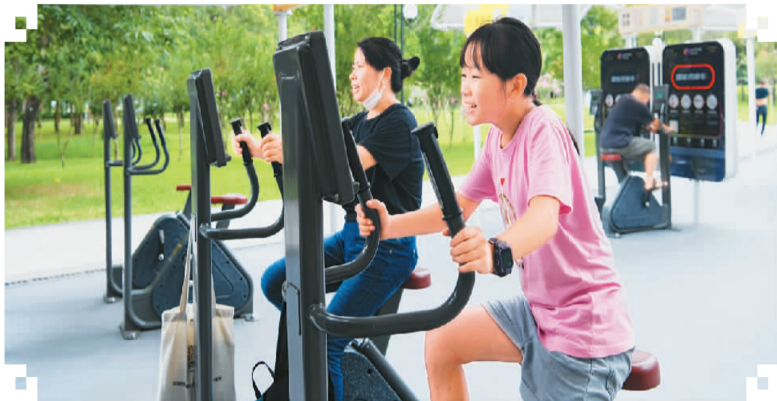
市民在深圳市莲花山公园的室外智能健身房做运动。

智慧公园，是在公园中运用“互联网+”思维，利用5G、物联网、大数据、云计算等新一代信息技术，对服务、管理、养护过程进行数字化运营、智能化控制和管理。业内人士指出，目前公园里的一些智能设施在人性化、便利度、实用性等方面还有很大提升空间。各地因地制宜打造智慧公园，让各种智能设施与公园里的山水景观、人文特色融合起来，提升游园的便捷性与幸福感。