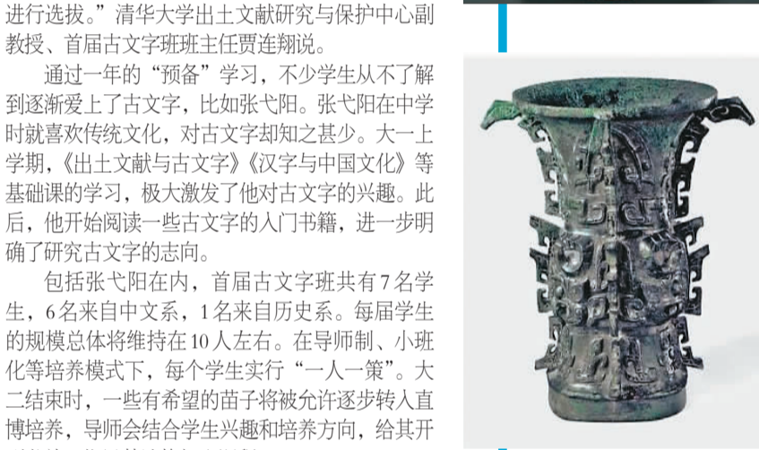
西周青铜器“何尊”。尊内底铸有铭文十二行，一百二十二字，其中“宅兹中国”为“中国”一词最早的文字记载。陕西宝鸡青铜器博物院藏