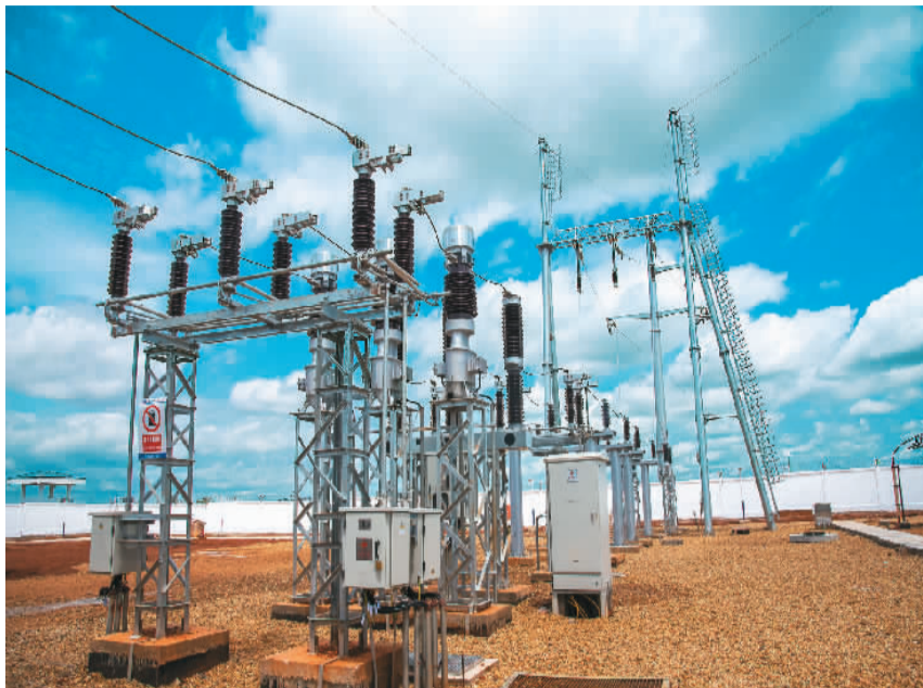
萨卡伊光伏电站是中非共和国首座光伏电站该电站，位于该国首都班吉附近的索博市，由中国能源建设集团天津电力建设有限公司总承包，装机容量为15兆瓦，其落成极大缓解了班吉的用电难，促进了当地社会经济发展。图为6月2日拍摄的萨卡伊光伏电站升压站。

肯尼亚智库“跨地区经济网络”近日发布一份调查报告称，中国对非合作在基础设施建设、快速决策及工程项目完工及时性等方面获得非洲人士高度认可。报告显示，过去15年，中国在非洲实施的路桥等基础设施合作项目正在“真实可见”地改变非洲面貌，帮助非洲国家推进互联互通建设和市场融合。事实证明，中国凭借