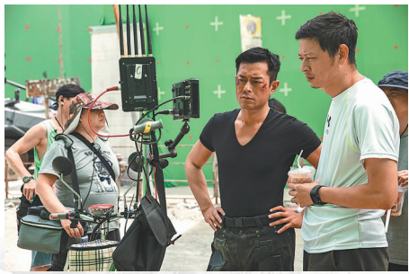
監製古天樂十分緊張拍攝效果。