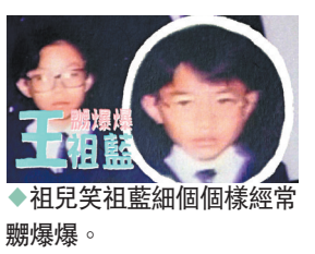
祖兒笑指藍細個個樣經常翻爆爆。