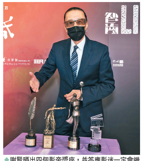
謝賢晒出四個影帝獎座,並答應影迷一定會繼續演下去。