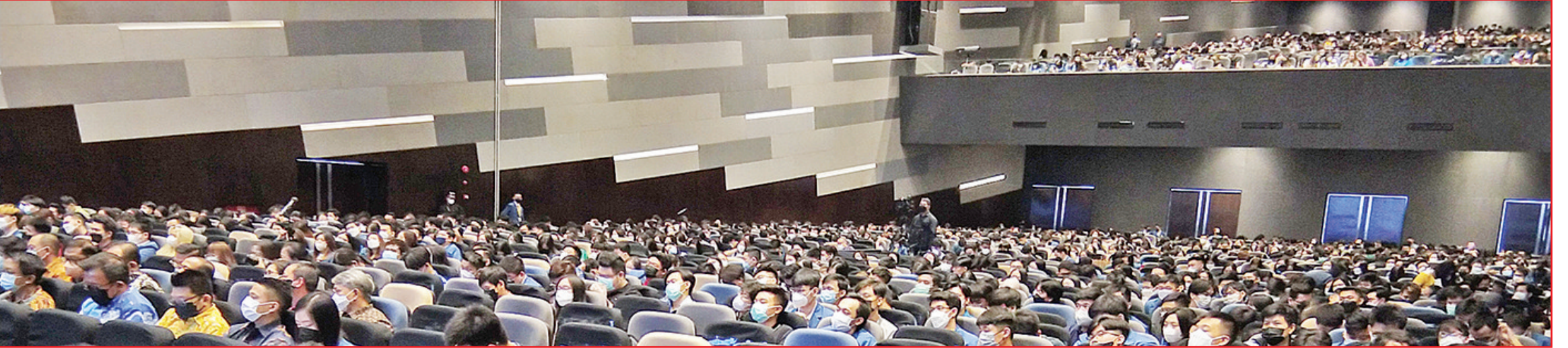
近2000名 Petra 基督教大学生在礼堂聆听翁俊民博士的精彩演讲