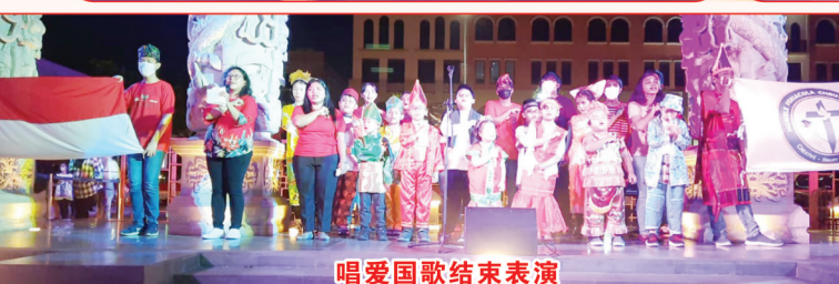
唱爱国歌结束表演