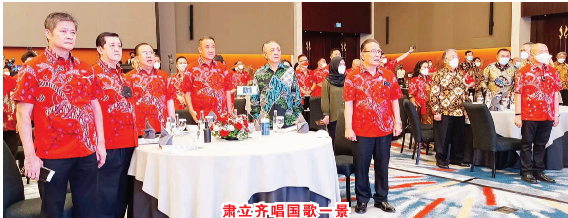
肃立齐唱国歌一景