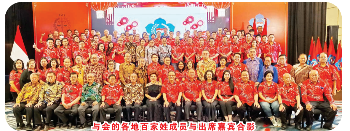
与会的各地百家姓成员与出席嘉宾合影