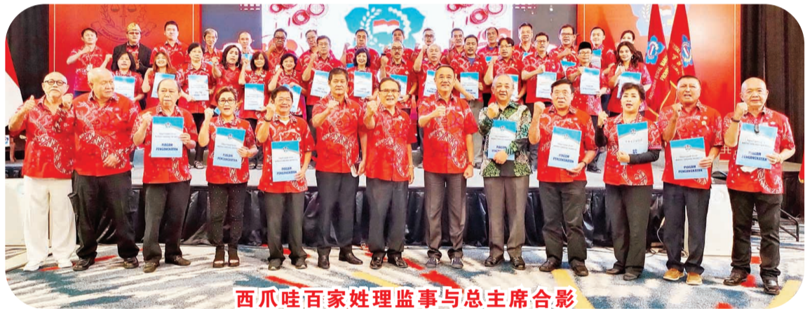
西瓜哇百家姓理监事与总主席合影