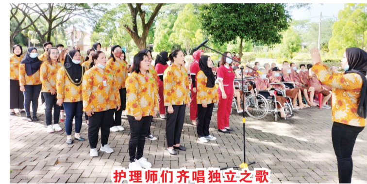
护理师们齐唱独立之歌

Cepat, Bangkit Lebih Kuat”努力工作,相互合作实现先进印尼的愿望。(国强报导)