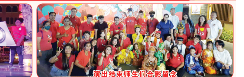
演出结束师生们合影留念