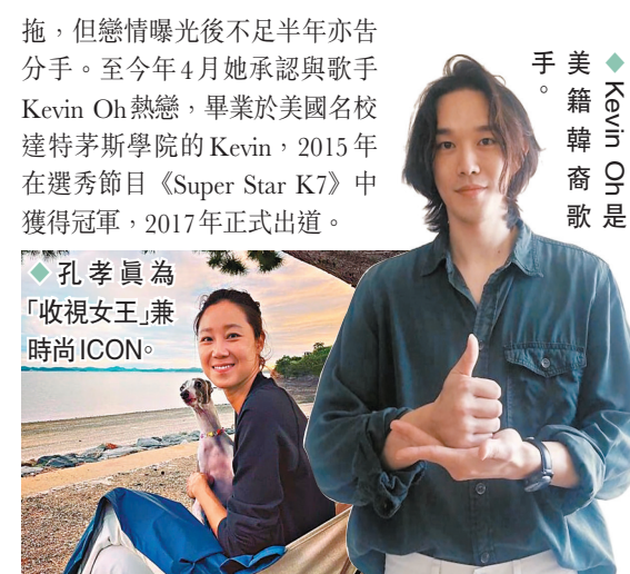
◆孔孝真為「收視女王」兼時尚ICON。

及送上祝福。 《沒關係, 是愛情啊》孔孝真今年3月出席孫藝珍和玄彬的世紀婚禮時, 成功接到新娘子的花球, 幸福果然降臨, 姊弟戀終修成正果。孔孝真與男友拍拖2年, 雖然兩人年紀相差10年, 但無懼世俗眼光愛得甜蜜。而孔孝真過往的情史亦非常豐富, 2002年拍攝電視劇《華麗的時節》和電影《No Manners》時與柳承範「撻着」, 不過交往一年後宣布分手, 但5年後又宣布復合, 到2012年他們透過經理人公司宣布分手。2014年孔孝真跟李陣郁拍