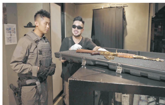
◆奶仔見識24K電鍍的AK47氣槍。

之後奶仔又試坐一部標價178萬元的法拉利458, 坐在車廂內都清楚聽到起跑時引擎的咆哮聲。接住到奶仔落場試駕開篷波子, 叫價82.8萬, 是奶仔目前人生揸過最貴的一款車。最後一站睇氣槍, 他見識到一支24k電鍍AK47, 雖然是玩具, 都要賣39,800元。奶仔表示很開心首次以監製身份去拍自己有興趣, 觀眾又睇得開心的題材, 不單增廣見聞, 又可以同觀眾分享。他說: 「想話畀大家聽, 唔好畀貧窮限制想像, 有錢有錢都好, 知識好緊要。」奶仔又透露希望可以再拍《野外步出》系列, 或者玩《野外步出: 泰國篇》, 帶大家到外地玩。