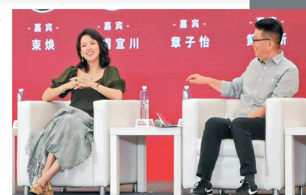
◆章子怡 (左) 與黃建新在論壇上暢談甚歡。