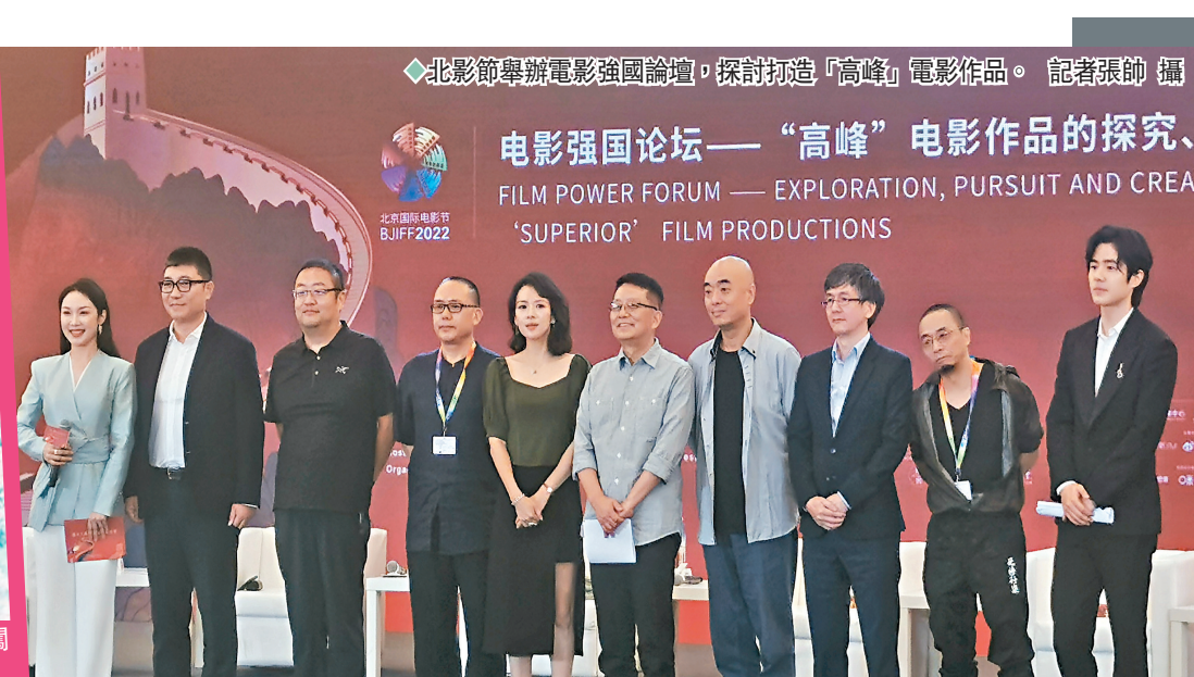
◆北影節舉辦電影強國論壇, 探討打造「高峰」電影作品。