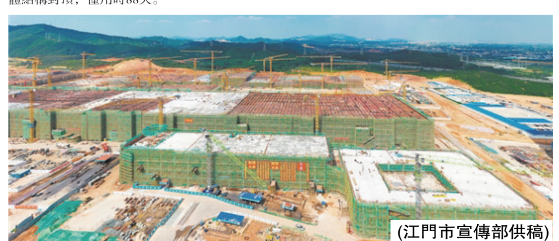
(江門市宣傳部供稿)