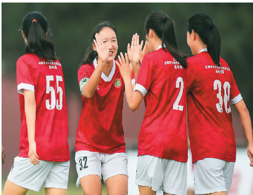
2020年全国青少年校园足球夏令营竞赛女子高中组比赛现场。

“这一全国性青少年足球竞赛平台之于学校体育改革、体教融合和中国足球改革都具有重要意义。”王登峰认为，中国