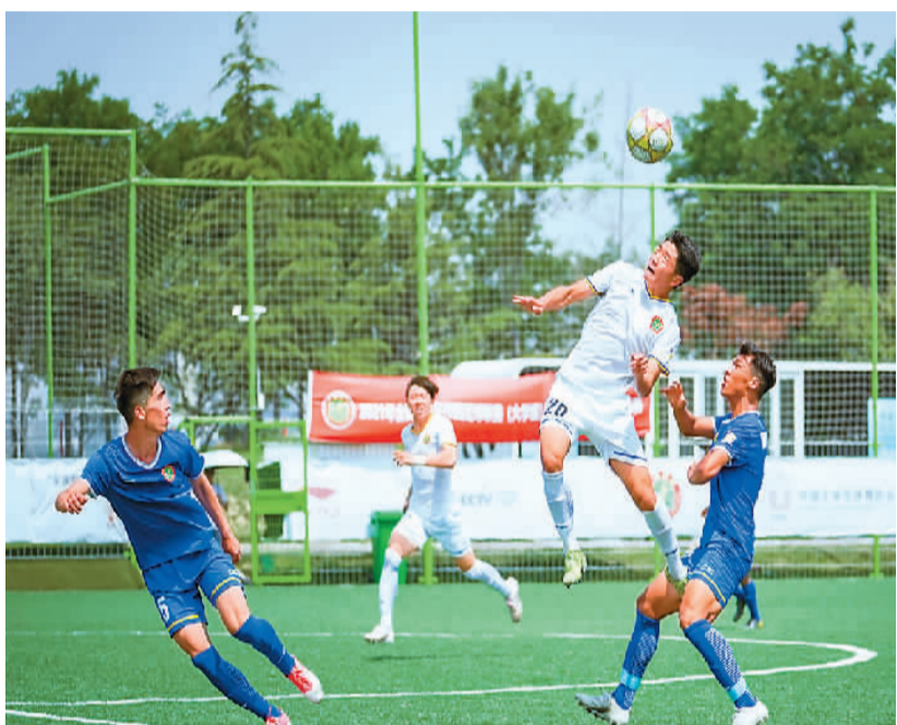
2021年全国青少年校园足球联赛（大学组）比赛现场。

青少年足球联赛打破了参赛壁垒和身份界限，可以为青少年足球运动员提供更多的比赛场次和实战锻炼机会，为中国足球遴选精英足球后备人才。