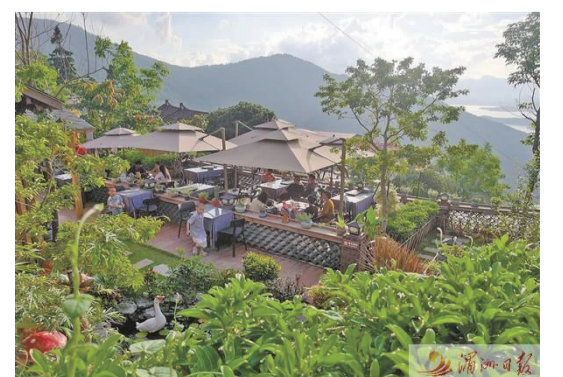
圖為市民在東圳水庫旁的餐廳休閒放鬆。