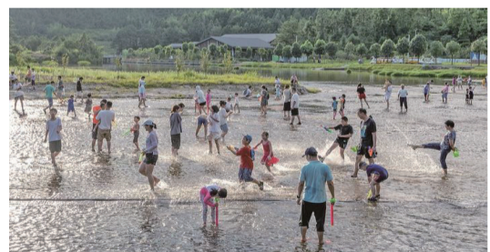
圖為8月6日,游客在仙水洋的淺水中嬉戲游玩。湄洲日報記者 蔡吳攝