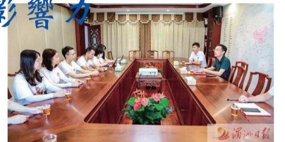
課題組一行前往湄洲媽祖祖廟開展座談交流。

此前,湄洲島管委會主任林鋒會見課題組一行,並簡要介紹了湄洲島的基本情況,交流過程中,課題組一行踴躍發言,暢談課題研究思路和設想。(湄洲日報記者 郭文淵 通訊員 許雙萍 林春盛 文/圖)