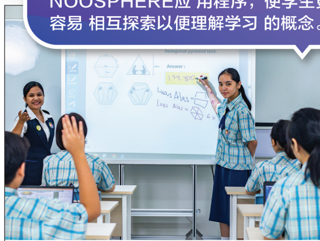
学生使用NOOSPHERE 进行小组圆桌讨论解决问题。

八华学校将批判性 思维能力和逻辑思考能力作为数学教学重点,通过批判性思维学习,学生能够在任何情况下 解决问题,使学生成为 集聪明才智与娴熟技能 于一身的年轻一代。