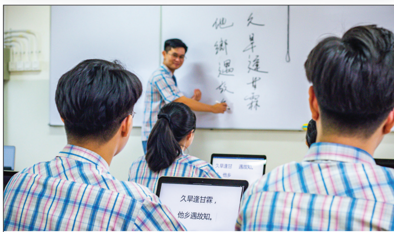
强化而高效的中文课堂教学

八华学校是提供语言教学以及道德教育的首倡学校,学校分别开 设印尼文、中文以及英文三种语言课程。学校拥有强大的中英文外教师资团队支持专业教学,不仅要求学生掌握良好的语言能力,而且要求学生能够用精准的语言来进行沟通与交流,从小提升学生的国际竞争力。