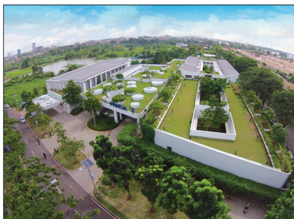
八华幼儿园荣获国际环保建筑设计大奖