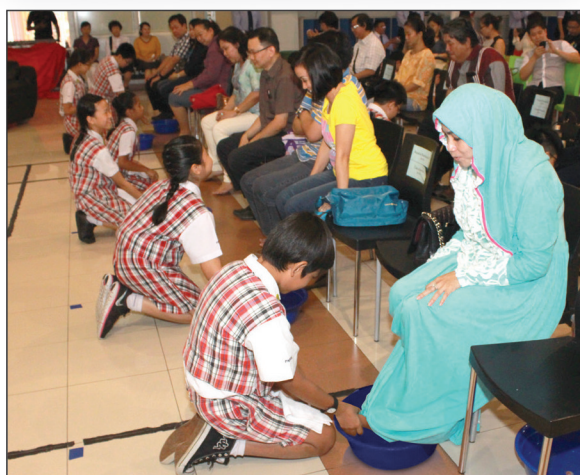
小学部孝亲节活动- 子女为父母洗脚

道德教育以及品格 培养旨在使学生在步入 社会后能够成为德才兼备的人。具有同理心,感恩、尊重、爱成为八 华道德教育的核 心价值 观。