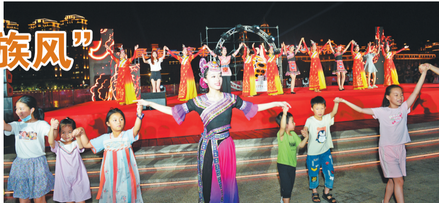
《我们都是一家人》节目演出,演员与观众互动。

在“闽江之心”青年广场,15米长的巨幅长卷展开,6名专业插画师和来自30多个家庭的孩子,一