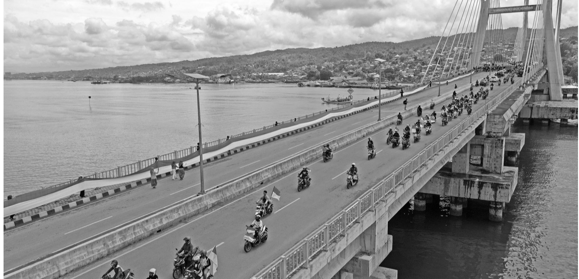
为迎接国庆日，Muhammadiyah Kendari 大学生同小学生和居民在肯达里湾大桥，悬挂了长达770米的红白国旗。