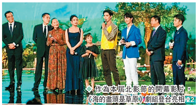
作為本屆北影節的開幕影片，《海的盡頭是草原》劇組登台亮相。