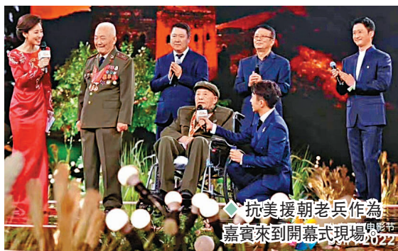
抗美援朝老兵作為嘉賓來到開幕式現場。