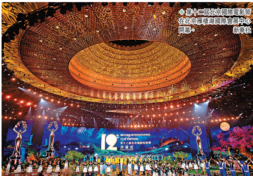
第十二屆北京國際電影節在北京雁棲湖國際會展中心開幕。

香港文匯報訊（記者 馬曉芳 北京報道）由國家電影局指導，中央廣播電視總台、北京市人民政府主辦的第十二屆北京國際電影節在北京雁棲湖國際會展中心正式啟幕。電影《撥雲見日》、《長津湖》、《刺蝟》、《斷橋》、《獨行月球》、《回西藏》、《海的盡頭是草原》、《媽媽！》、《明日戰記》、《一路瞳行》、《追月》、《中國青年：我和我的青春》等劇組主創代表，以及陳寶國、爾冬陞、古天樂、葛優、惠英紅、林峯、馬麗、沈騰、吳京、王俊凱、肖央、詠梅等影人走上紅毯，在雙奧之城綻放影人風采。主辦方還邀請抗美援朝志願軍老兵、科學家、奧運冠軍參加紅毯和開幕式，而「天壇獎」入圍影片推介更讓觀眾看到了世界電影的不同面貌。