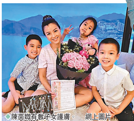
◆ 陳茵媺有教子女護膚。