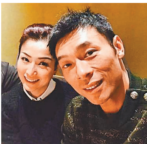
◆ 許志安與Sammi感情如舊。