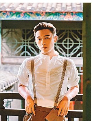
◆ MC張天賦的新歌受歡迎。

香港文匯報訊 (記者 林子棠) MC張天賦的新歌《老派約會之必要》於推出首日，即以逾10萬點播次數登上Spotify日榜第一位，最高達13萬次，成為Spotify自2014年有紀錄以來香港地區最高點播次數的歌曲；並且至今已連續42周躋身榜中，成為Top Artist榜最長時間的歌手。而歌曲亦在香港各大音樂平台獲得優秀成績。