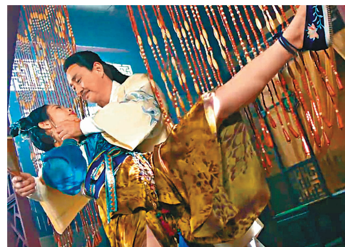
◆ 麥美恩跟吳岱融過招，場面精彩。