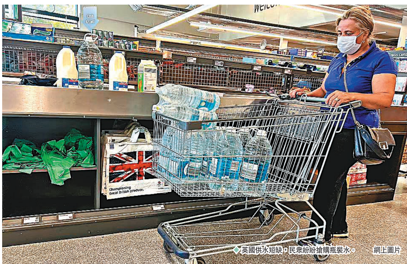
◆英國供水短缺，民眾紛紛搶購瓶裝水。網上圖片