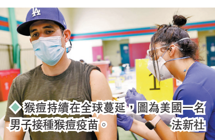
◆猴痘持續在全球蔓延，圖為美國一名男子接種猴痘疫苗。