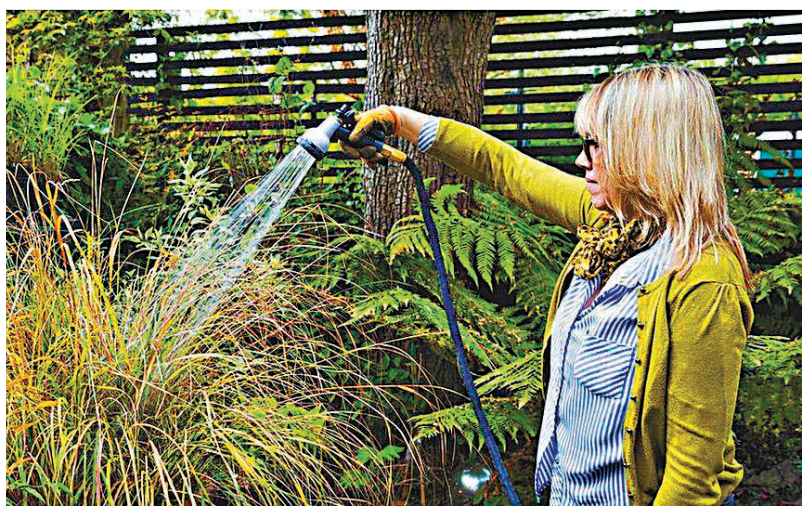
◆在「軟喉禁令」實施下，人們不得用軟喉澆水為植物灌溉。網上圖片

英國近期遭遇嚴重乾旱，環境署宣布將包括倫敦的英格蘭8個地區列為乾旱地區，當地水務公司亦開始透過「軟喉禁令」等措施限制用水，即禁止人們用軟喉澆水，為花園或植物灌溉和洗車等，並呼籲民眾節約用水，包括將淋浴時間限制在4分鐘內，以及在為植物灌溉時，使用洗澡後的浴缸水。由於供水短缺，不少人紛紛到超市搶購瓶裝水，貨架被掃空，個別分店更因此推出限購令。