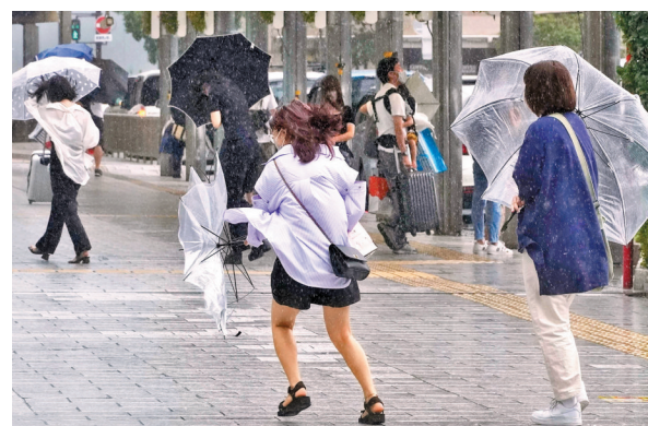
◆熱帶風暴米雷13日登陸日本。