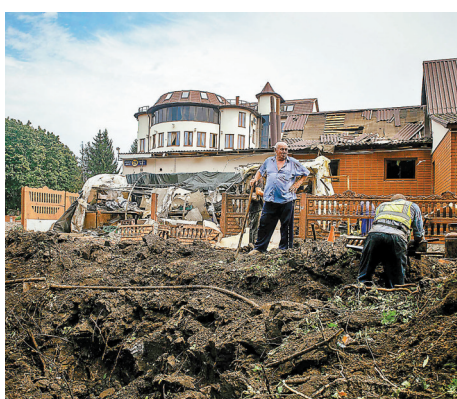
◆烏克蘭經濟在戰火下受到嚴重打擊。

據《華爾街日報》報道，在俄烏衝突持續下，烏克蘭的軍費開支愈來愈沉重，然而美國等西方國家未有提供足夠財政援助，烏克蘭現時只能冒著通脹暴升的風險，不斷「印鈔票」以應付戰事開支。