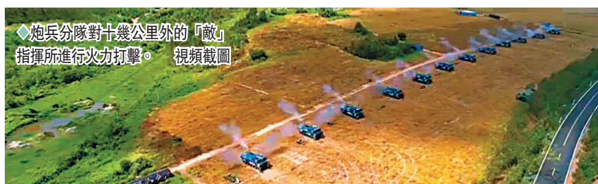
炮兵分隊對十幾公里外的「敵」指揮所進行火力打擊。視頻截圖