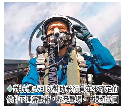
對抗模式可以幫助飛行員在不確定的條件下理解戰術，熟悉戰場。視頻截圖