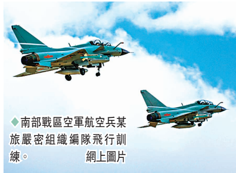
南部戰區空軍航空兵某旅嚴密組織編隊飛行訓練。網上圖片