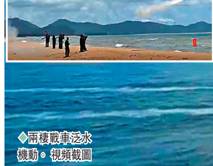
兩艘戰車泛水機動。視頻截圖

香港文匯報訊 據環球網報道，立秋時節，南部戰區海軍某掃雷艦大隊數艘艦艇解纜起航，奔赴南海某海域開展為期5天的掃海警戒任務。此次任務，該大隊綜合海區戰場態勢精細研判，嚴密制定方案預案，將實戰化演訓有機融入掃海警戒任務全程，有效檢驗了編隊指揮所組織籌劃、兵力布勢、通信互聯、應急處置等能力，全面提升實戰化部署條件下指揮員組織指揮能力和戰術謀略水平。