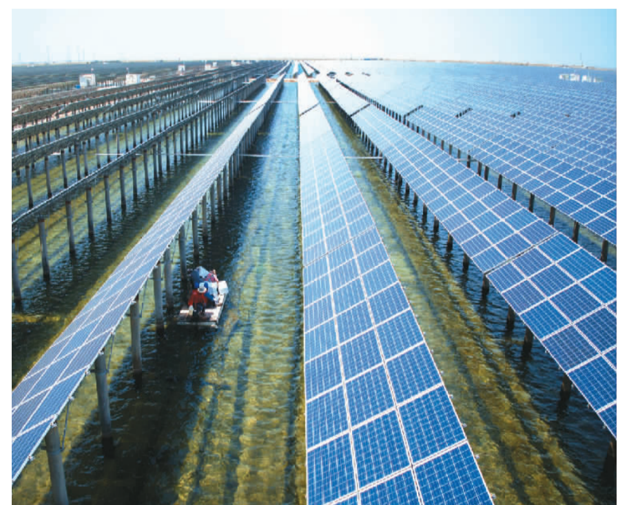
山东省东营市河口区充分利用立体空间，融合“风、光、海、渔”等资源要素，大力发展光伏发电、风力发电等绿色新能源产业，实现经济、生态双丰收。目前，河口区新能源发电装机容量达118万千瓦，新能源年发电量突破18亿千瓦时。图为位于河口区万亩生态渔业区浅滩内的曙光汇泰渔光电站，当地供电公司工作人员乘船巡检光伏设备。

会议旨在通过对中国企业在海外投资与贸易活动中所关注的法律问题进行研讨，引导推动出海企业做好法律风险防范，积极有效地运用符合国际规则的法律手段维护自身权益。