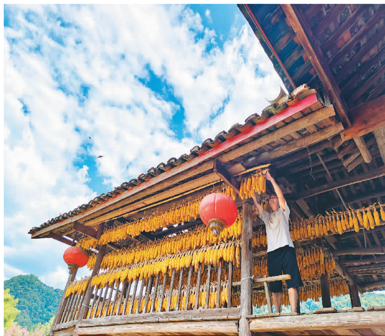
立秋时节，湖南省邵阳市城步苗族自治县苗寨群众将收获的玉米、高粱、花生、大豆等农作物晾晒在吊脚楼上，摊晒在庭院中，呈现一派丰收的喜人景象。图为八月十二日，在城步苗族自治县开江口镇边溪村，村民晾晒玉米。