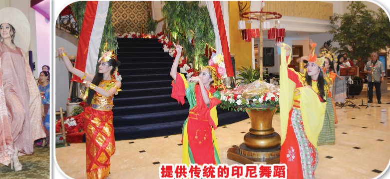
提供传统的印尼舞蹈