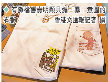
有攤檔售賣明顯具煽「暴」意圖的衣服。

香港文匯報記者發現，有的攤位銷售飾品，有的則銷售諸如卡套、磁石、「尿袋」（流動充電器）、盒子、上衣等物品。在這些貨品上，大多會印上與2019年黑暴時期相關文宣及標語，有的衣物上更直接貼着黑暴形象的圖案。