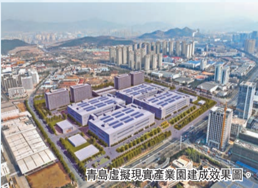
青島虛擬現實產業園建設效果圖。