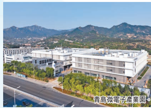
青島微電子產業園。

為夯實實體經濟根基，嶗山區實施「匯智嶗山」十大人才工程，獎勵高層次人才、優秀企業家超過5166萬元。率先發布《嶗山區加快實體經濟振興發展、建設「四新」經濟集羣區三年行動方案》，圍繞先進製造業、科技創新、樓宇經濟和高端中介服務等