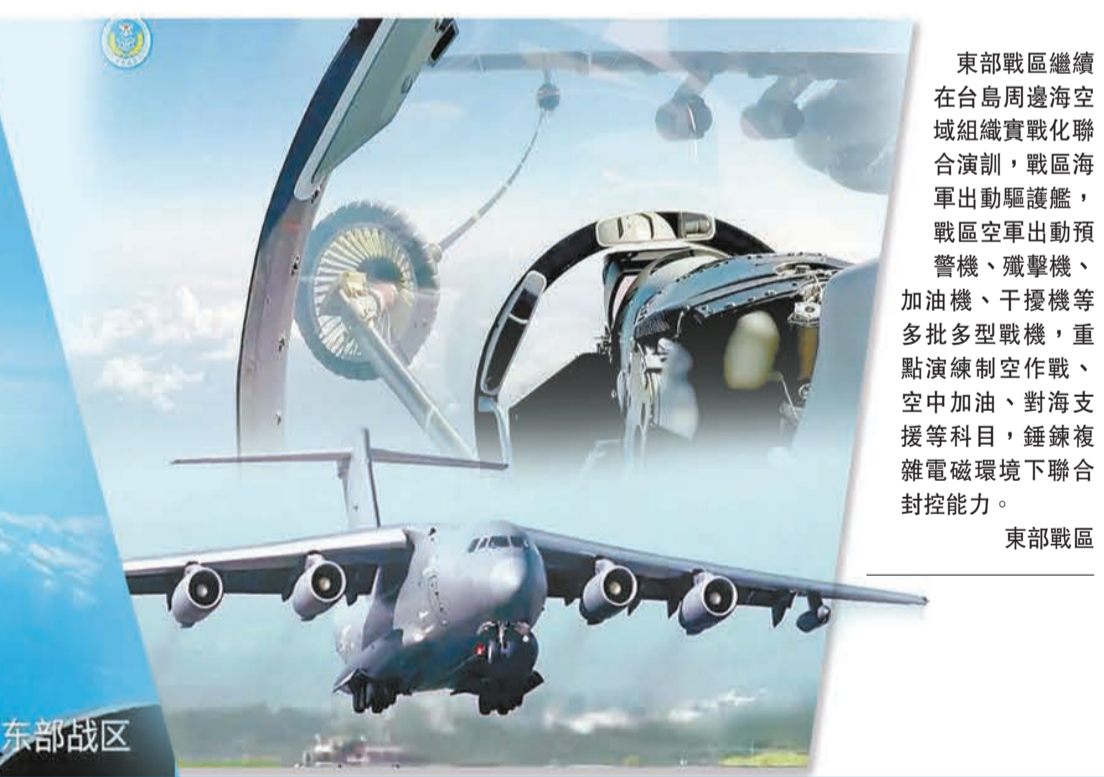
東部戰區繼續在台島周邊海空域組織實戰化聯合演訓，戰區海軍出動驅逐艦，戰區空軍出動預警機、殲擊機、加油機、干擾機等多批多型戰機，重點演練制空作戰、空中加油、對海支援等科目，錘鍊複雜電磁環境下聯合封控能力。