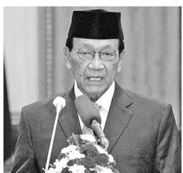
苏丹哈孟古布沃诺再成为日惹特区省长