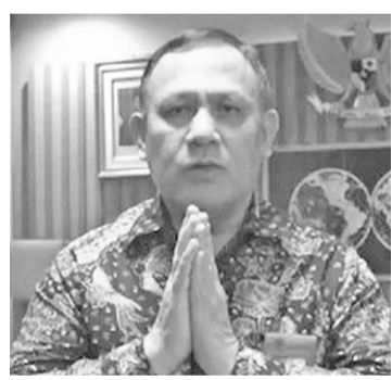
肃贪委员会主席费尔利(Fidi Bahuri)

【本报讯】肃贪委主席费尔利(Fidi Bahuri)声称,某些人士对他所领导的机构的形象的一些调查结果,他并不感到过敏。 费尔利周一(8/8)表示,与该肃贪委有关的的所有调查结果都没有错。但是,调查的时间将决定公众的反应。因此,如果是在燃料价格增加的时候进行调查,问题只有一个,即政府是亲民的吗?答案肯定是“不”。 费尔利坦言,总是阅读各种机构进行的调查结果。不仅如此,肃贪委甚至邀请了调查机构,并询问了调查结果以及受访者及其方法。然而,这些机构中的一些调查的数量,仍然远远不是肃贪委的完整性评估调查的受访者。为什么?因为受访者的数量是25万5010,这是最大数量。在前些天的可选性调查中,只有1200人。 (亮剑)