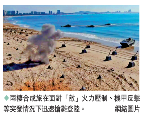
◆兩棲合成旅在面對「敵」火力壓制、機甲反擊等突發情況下迅速搶灘登陸。網絡圖片

香港文匯報訊 綜合報道：東部戰區9日繼續在台島周邊海空域組織實戰化聯合演訓，戰區海軍出動驅護艦，戰區空軍出動預警機、攔截機、加油機、干擾機等多批多型戰機，重點演練制空作戰，空中加油、對海支援等科目，錘煉複雜電磁環境下聯合封控能力。新一代空中加油機運油-20在較短時間內就完成了雙機對接加油，發揮了空中戰力倍增器作用。