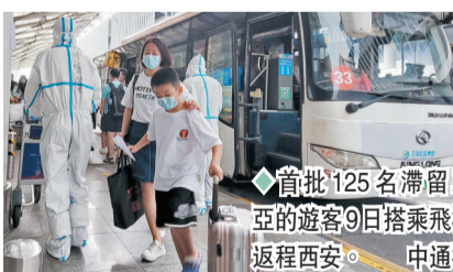
◆首批125名滯留三亞的遊客9日搭乘飛機返程西安。中通社