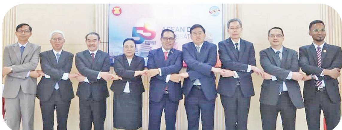
各大使及各代表们合影