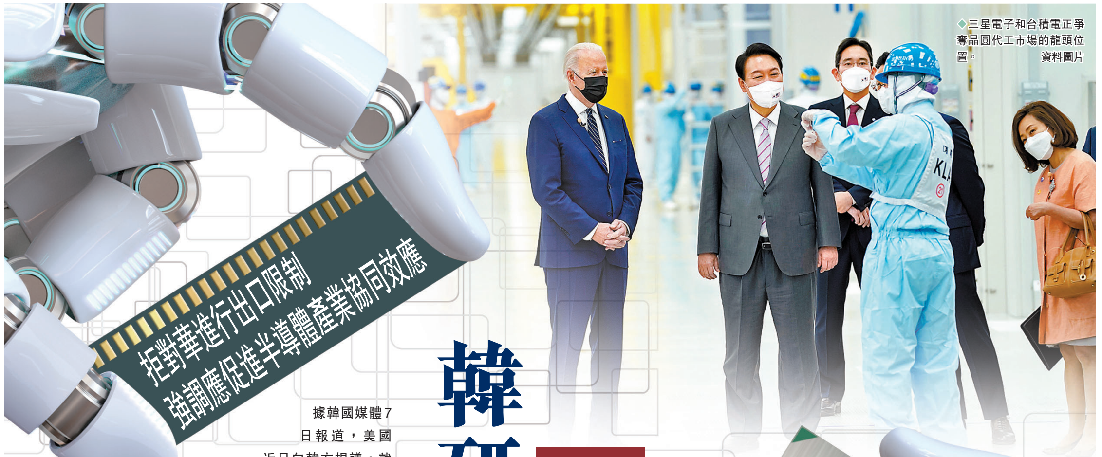
◆三星電子和台積電正爭奪晶圓代工市場的龍頭位置。 資料圖片

據韓國媒體7日報道，美國近日向韓方提議，就韓國是否參加「晶片四方聯盟」(Chip 4)舉行預備會議，韓國政府已向美方轉達願意出席預備會議的意向，並會向美方提出Chip 4要以「參與國應尊重中國強調的一個中國原則」和「不提及對華進行出口限制」為前提。