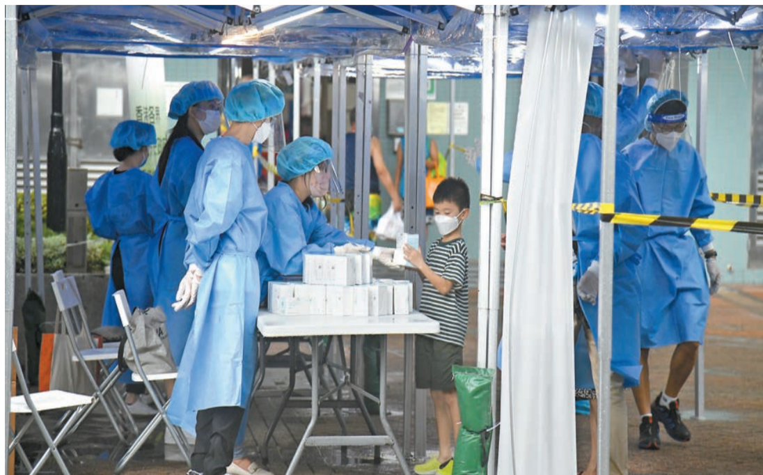
本港確診數字昨日維持在四位數，其中馬鞍山錦泰苑錦蔚閣須圍封強檢。

【香港商報訊】記者何加祺報道：本港新冠肺炎疫情持續，昨日新增4040宗確診個案，包括233宗輸入個案、3807宗本地個案。衛生署衛生防護中心傳染病處主任張竹君昨日表示，現時懷疑Omicron BA.4或BA.5的個案繼續增加，初步數據佔整體的12.7%，超越BA.2.12.1；而BA.5個案亦呈上升趨勢，不排除會成為本港主流病毒。