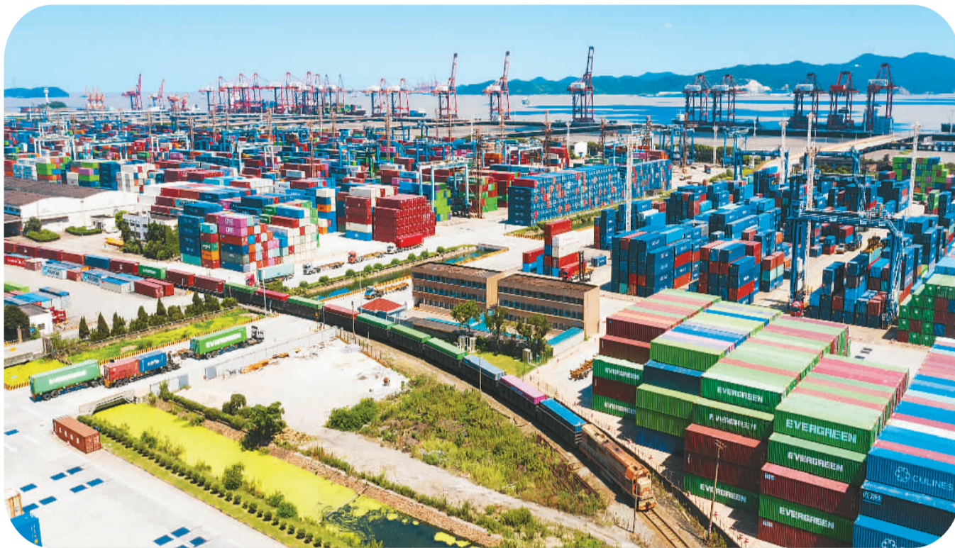
▲海铁联运正成为提升进出口物流效率的重要途径。图为8月4日，浙江宁波舟山铁路北仑港站，大型机械正在吊运集装箱货物，一列满载集装箱货物的海铁联运班列缓缓驶离铁路北仑港站，一派繁忙景象。

中国有14亿多人口和4亿以上中等收入群体，每年进口商品和服务约2.5万亿美元，市场规模巨大。如今，中国市场正在成为世界的市场、共享的市场、大家的市场，为国际社会注入更多正能量。