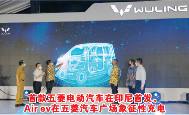
首款五菱电动汽车在印尼首发, Air ev在五菱汽车广场象征性充电