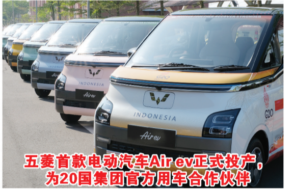
五菱首款电动汽车Air ev正式投产, 为20国集团官方用车合作伙伴