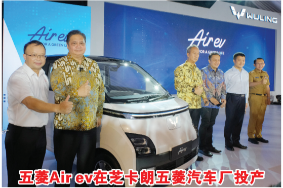
五菱Air ev在芝卡朗五菱汽车厂投产