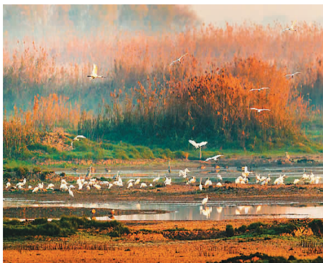
武汉沉湖国际重要湿地。