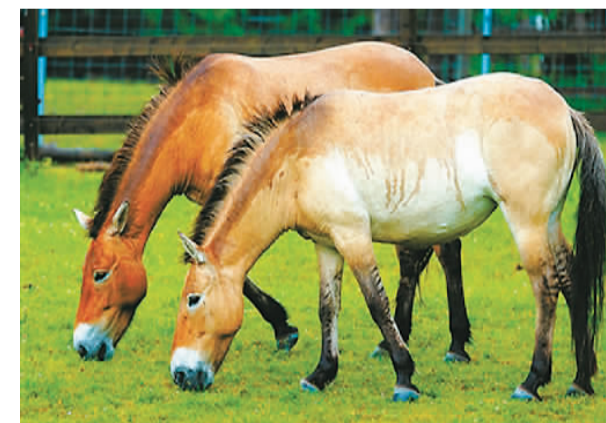
图为普氏野马。

普氏野马是地球上少数通过圈养繁殖而存活下来的珍稀物种之一，曾栖息在从准噶尔盆地到蒙古高原西南部的荒漠草原地带，是保存马科动物遗传多样性及用于家马性状改良和育种的珍贵物种，具有重要的生物学意义。