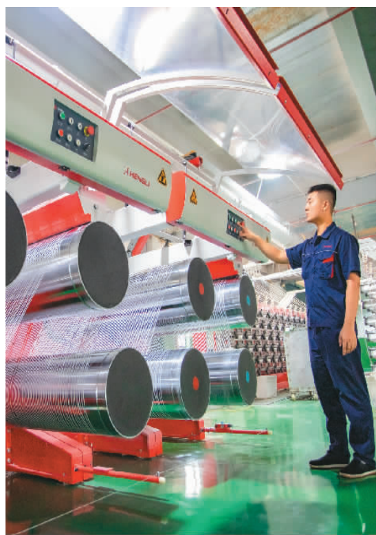
江西省九江市湖口县新动能产业园内的教正塑业有限公司内,工人正在赶制出口订单。

本报北京8月5日电 (记者邱海峰) 国家外汇管理局5日公布的国际收支平衡表初步数据显示,2022年上半年我国国际收支保持基本平衡。其中,经常账户顺差1691亿美元,与同期国内生产总值(GDP)之比为1.9%,继续处于合理均衡区间;来华直接投资净流入1496亿美元。