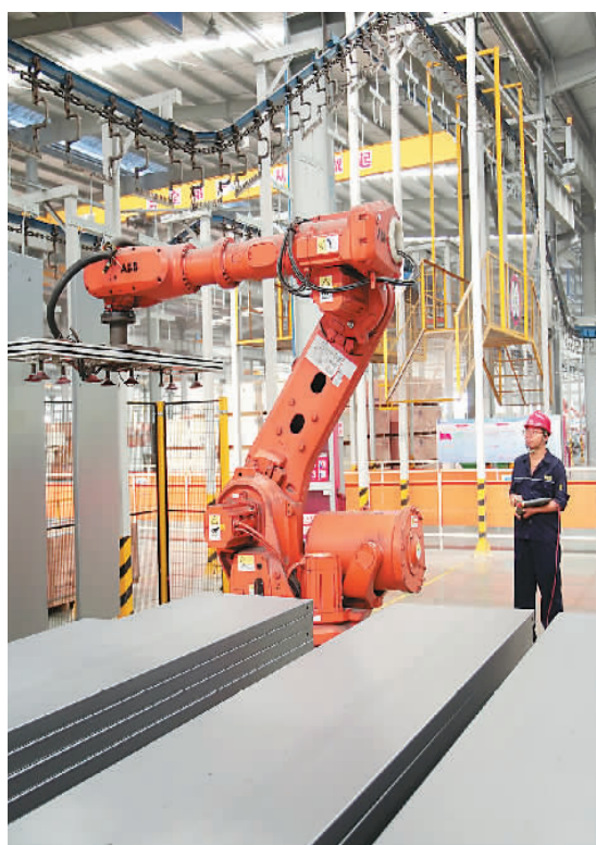
浙江省湖州市南浔区练市镇恒达富士电梯有限公司内,工人在生产发往海外的电梯。