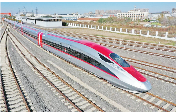
雅万高铁动车组在青岛下线