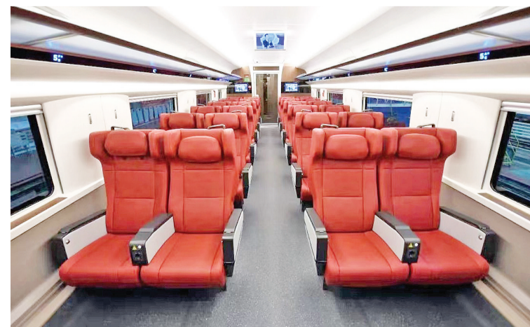
动车组内部一览雅万高铁动车组将交付印尼