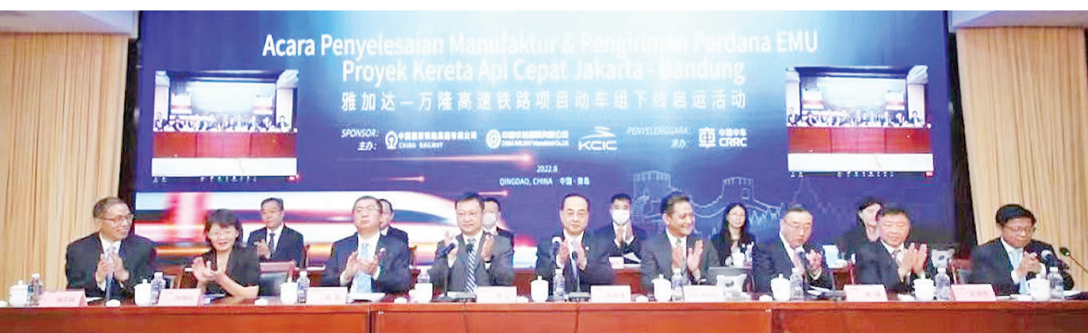
副大使与各领导在北京线下参与活动

同时,印尼交通部长、海洋事务和渔业统筹部秘书、青岛市长、中铁投资等领导以及中铁国际集团(CRIC)、印中高铁公司(KCIC)、中国中车(CRRC)、中国铁路、国家发展和改革委员会