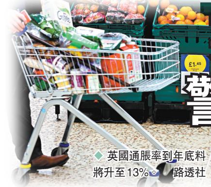
◆英國通脹率到年底料將升至13%。