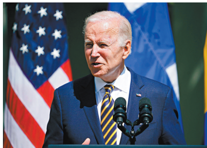
◆拜登政府正試圖游說民主黨參議員避免法案通過。

美國眾議院議長佩洛西高調訪台，台海局勢變得緊張之際，美國參議院外交委員會原定在當地時間3日審議的「台灣政策法案」被延期引起廣泛關注。知情人士指出，拜登政府正試圖游說民主黨參議員避免這項新法案通過。報道指，外交委員會原定在3日下午審議由委員會主席、民主黨的梅嫩德斯和共和黨參議員格雷厄姆6月提出的「台灣政策法案」，但在事前臨時以梅嫩德斯必須參與院會事宜為由，延遲審議法案。「台灣政策法案」長達107頁，集結近年幾乎所有涉台法案重點。根據美國立法程序，法案若在參議院外委會過關，仍須獲得參、眾兩院通過，才可遞交總統簽署後生效。