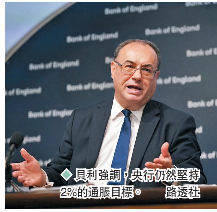
◆貝利強調，央行仍然堅持2%的通脹目標。

英倫銀行4日議息後宣布加息半厘，指標利率由1.25厘升至1.75厘，是金融海嘯後最高水平，也是27年來最大幅度的一次加息。英倫銀行預測，英國通脹率到年底將升至13%，警告英國將陷入金融海嘯以來最長的經濟衰退期，生活水平倒退程度將是60多年來最嚴重。消息拖累英鎊匯價由升轉跌，報1.2184美元水平。