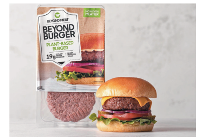
◆Beyond Meat股價連番下挫。