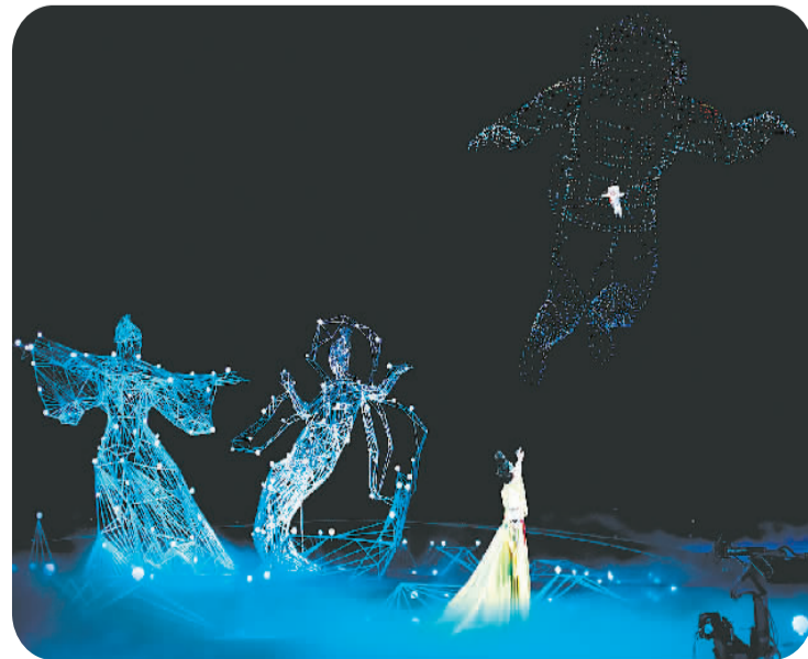
2022年中央广播电视总台七夕晚会