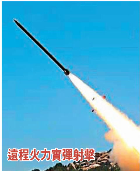
遠程火力實彈射擊

香港文匯報訊 綜合新華社、央視新聞、中新網報道，根據公告，中國人民解放軍將於北京時間8月4日12時至7日12時在台島周邊海空域進行重要軍事演訓行動。4日13時許，中國人民解放軍東部戰區陸軍部隊在台海峽實施了遠程火力實彈射擊訓練，取得了預期效果。4日下午，東部戰區火箭軍部隊對台島東部外海預定海域實施常導火力突擊，全部精準命中目標。專家表示，今次實戰演訓選擇環島六大區域，範圍廣、靠島近、力度大、要素全，可對台島形成包圍之勢，有利於重新塑造統一的戰略格局。