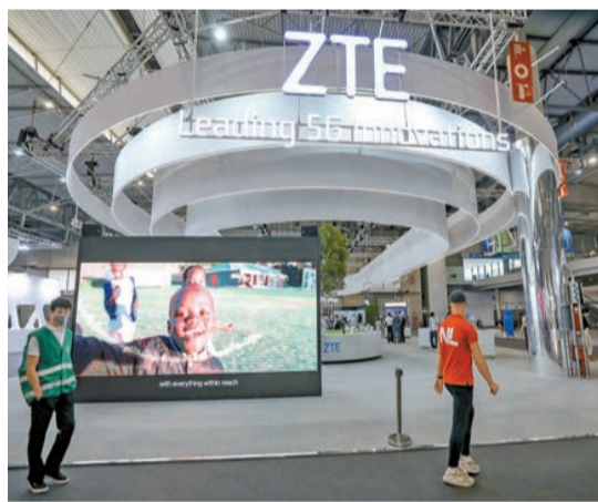
中興通訊表示，全球6G研究處於早期的「百花爭鳴，百家齊放」階段。

2021年年報顯示，中興通訊集團是全球電訊市場的主導通訊設備供應商之一，業務覆蓋160多個國家和地區，服務全球四分之一以上人口。