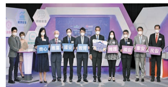
梁振英（右五）與嘉賓出席「國家安全教育通通識校際挑戰賽」總決賽暨頒獎典禮。

「知識王者（學校獎）」方面，中學組冠軍為東華三院李嘉誠中學、亞軍為保良局李城璧中學、季軍為香港管理專業協會羅桂祥中學。小學組冠軍是吳氏宗親總會泰伯紀念學校、亞軍是保良局林文燦英文小學、季軍是香港道教聯合會圓玄學院石圍角小學。