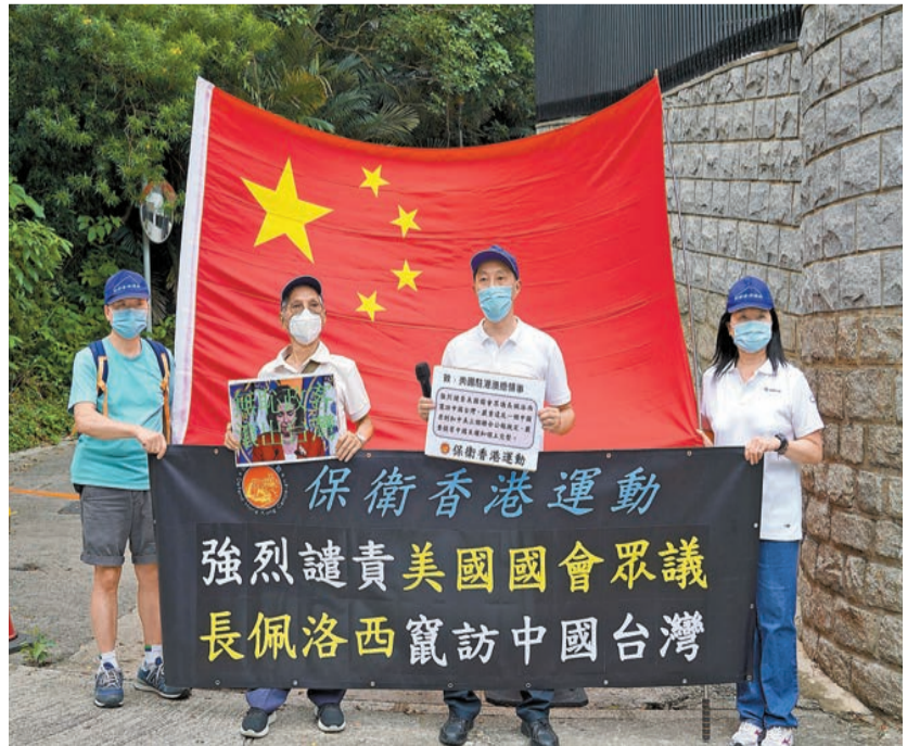
▲昨日，民建聯、工聯會、香港廣東社團總會、香港汕頭商會、保衛香港運動等團體和個人到駐港總領事館請願，強烈譴責佩洛西竄訪中國台灣地區。

抗議。全國人大常委會香港基本法委員會副主任譚惠珠表示，佩洛西竄訪台灣，其實是企圖鼓動「台獨」「以台制華」。 新民主黨、經民聯、自由黨、新界社團聯合會，以及香港專業及資深行政人員協會、港區省級政協委員聯誼會、香港政協青年聯會、香港島各界聯合會、教育評議會、新界校長會等直斥佩洛西行爲惡劣，爲「台獨」分子撐腰打氣，企圖「以台制華」；玩火者必自焚，此等行爲注定失敗。一眾團體表示全力支持國家採取強而有力的措施，捍衛國家安全和領土完整。