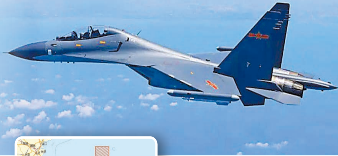
解放軍將從今天12時起在台島周邊進行重要實彈軍演。圖為東部戰區昨天繼續在台島周邊海空域組織實戰化聯合演訓，海軍任務艦艇當天已依令抵達台島以東預定海域。

【香港商報訊】據新華社、中新社報道，國台辦發言人馬曉光昨日正告蔡英文及民進黨當局，勾連外部勢力進行謀「獨」挑釁，以逞一己一黨之私，最終只會加速自身覆滅，把台灣推向災難深淵。馬曉光宣布對「台獨」頑固分子關聯機構予以懲戒。他說，有關部門即日起對從台灣地區輸往大陸的葡萄柚、檸檬、橙等柑橘類水果和冰鮮白帶魚、凍竹筴魚採取暫停輸入措施；同時，決定暫停天然砂對台出口。當天外交部例行記者會上，針對「中方將會採取何種反制措施」問題，外交部發言人華春瑩明確表態：該有的都會有，有關措施堅決、有力、有效，美方和「台獨」勢力會持續感受到。