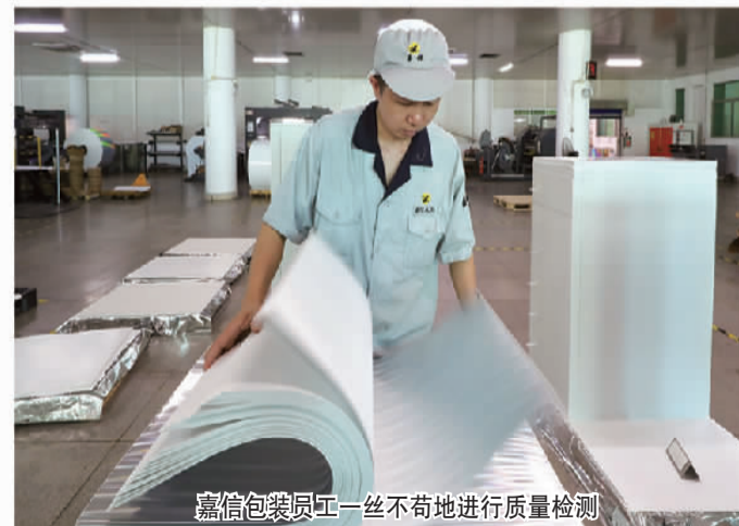
嘉信包装员工一丝不苟地进行质量检测