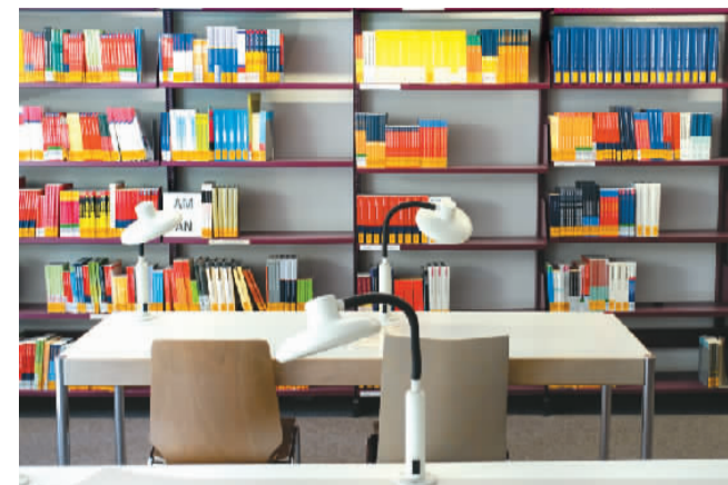
慕尼黑大学图书馆内景。

打开柜子、存好包，我提着图书馆给访客准备的篮子，沿着楼梯上行，在图书馆的一天就这样开始了。通常，我会选择靠窗边的位置坐下，阅读累了，还可以欣赏窗外景色。