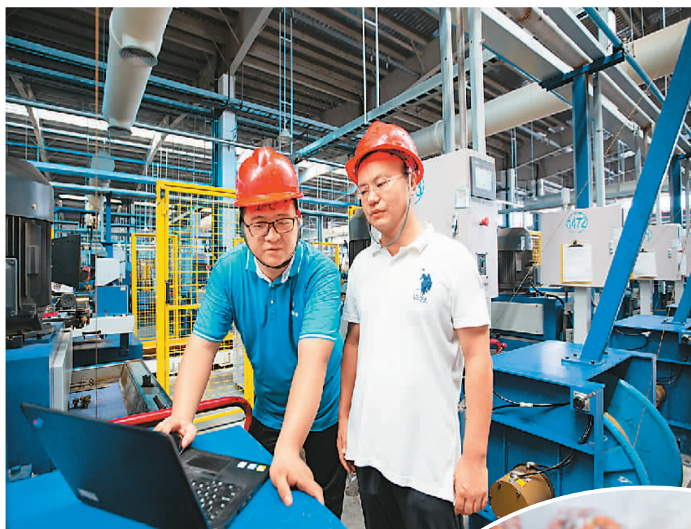
山东省东营市广饶县积极引导企业保生产、稳订单，通过缓缴社保等一系列中小企业纾困帮扶政策，助企业拓展市场订单。图为7月29日，在广饶县一家企业车间内，驻企联络员了解生产经营状况。

“三项社保费缓缴不会影响相应社保待遇的发放。”武汉科技大学金融证券研究所所长董登新在接受本报记者采访时说，目前全国养老、失业、工伤三项社保基金累计结余超过6万亿元，从整体规模来看，可以保障当期社保待遇支付。缓缴期满后，企业补缴社保费，从长期看也不影响社保基金的正常运转。“但对确实遇到阶段性困难的企业来说，缓缴政策对维持经营运转、缓解资金压力能带来实实在在的帮助。”董登新说。