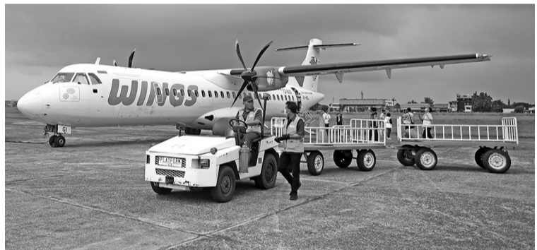
南丹格朗 Pondok Cabe 机场正式启用 从今年8月5日开始,万丹省南丹格朗 Pondok Cabe 机场正式启用,由翼航公司(Wing Air)负责提供客运服务,从这里飞往普尔巴灵加、直布、布洛拉、苏民纳、坤甸和楠榜等地区。

中小微企业有很大的机会在各自领域中使用数字化,并在全球危机中提高生存的机会。然而彼玛自承,中小微企业在进入数字经济的机遇中获取科技仍是一个挑战。此外,资金、投资、市场、以及商务治理能力对