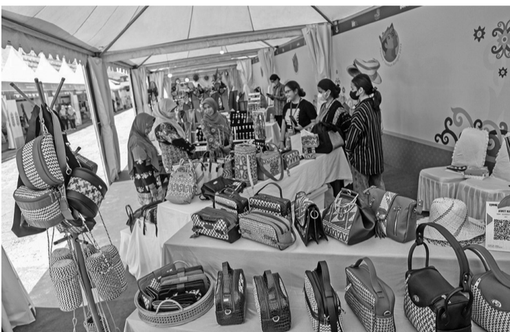
中加省中小微业展览会 央行中加省分行在巴朗卡拉雅县 KONI 大楼举办中小微业展览会,目的是要推动当地经济的发展,以及吸引游客们前来观光。

根据估计,2025年电子商务交易价值会达到1040亿美元或相当于1400万亿盾,并对本国生产总值的贡献约为5%。甚至,彼玛对电子商务在将来会继续增长及对本国生产总值作出10%的贡献表示乐观。 (Ing)