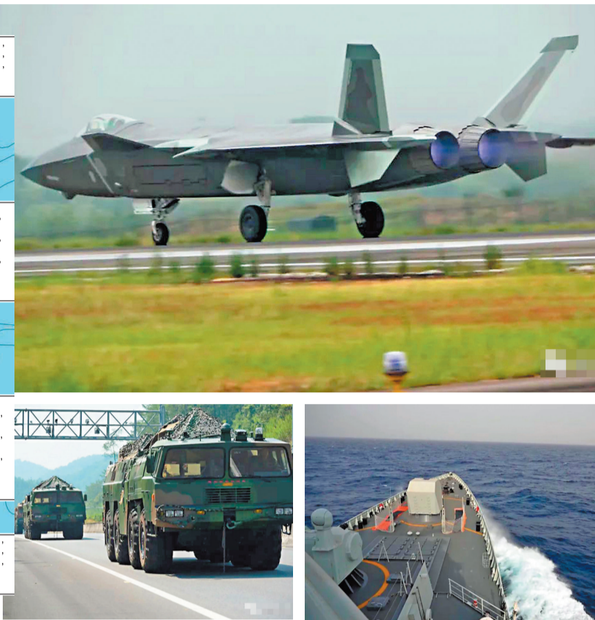
◆解放軍東部戰區3日在台島周邊海空域組織實戰化聯合演訓，重點演練了聯合封控和聯合對陸對海打擊。

央視新聞報道，8月3日，解放軍東部戰區在台島周邊海空域組織實戰化聯合演訓。東部戰區空軍上午出動預警機、殲擊機、轟炸機等多型先進戰機，從多機場戰鬥起飛，到多空域執行任務，開展預警指揮、干擾壓制、兵力進壓等。東部戰區海軍在台島周邊海域開展聯合封控和聯合對陸對海打擊等多課目針對性演練。海軍任務艦艇已依令抵近台島以東預定海域，完成海上警戒封控布勢，正與空中兵力聯合開展海上封鎖、對空攔截等課目訓練，充分發揮海空協同一體封控實戰能力。 據了解，當日上午，東部戰區已重點組織對台島多方向高強度海空抵近攔壓、海上多向進逼，全時位台島周邊偵察預警，檢驗部隊聯合作戰能力。 央視新聞早前報道，解放軍空軍蘇-35戰機2日晚間穿越台灣海峽。東部戰區新聞發言人施毅陸軍大校表示，8月2日晚開始，中國人民解放軍東部戰區在台島周邊開展一系列聯合軍事行動，在台島北部、西南、東南海空域進行聯合演訓，在臺灣海峽進行遠程火力實彈射擊，在台島東部海域組織常導火力試射。此次行動，是針對美近期在台海問題上消極舉動重大升級採取的嚴正震懾，是對「台獨」勢力謀「獨」行徑的嚴重警告。 外交部深夜召見美駐華大使嚴正交涉 據中新社報道，2日深夜，中國外交部副部長謝鋒奉命緊急召見美國駐華大使伯恩斯，代