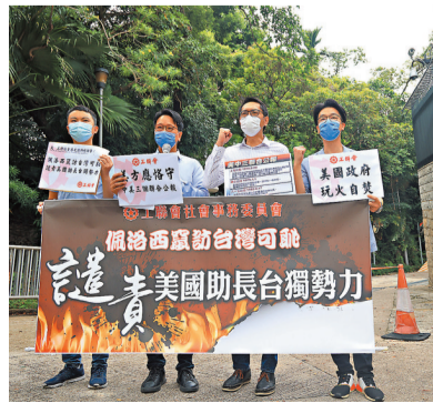
◆香港3日有市民前往美國駐港總領事館示威，譴責佩洛西訪台。

的根本原因在於，台灣當局一再企圖「倚美謀獨」，而美方一些人有意搞「以台制華」。 佩洛西執意竊訪當然不是真正「關心」台灣，而是帶着明確的政治目的。一方面，美國中期選舉臨近，佩洛西企圖借挑戰中國核心利益，來為選情吃緊的民主黨拉票加分；另一方面，佩洛西也借此給個人政治生涯「添上一筆」。政治私利裹挾下，台灣民眾成為最大受害者。 在佩洛西此行挑戰中國核心利益的情況下，中美開展合作的基礎何在？佩洛西的政治冒險行為導致台海局勢進一步升級，衝擊亞太地區的和平與穩定，讓世界看清美方為一己之私犧牲他人的真面目。美方一方面承諾堅持一個中國原則，一方面不採取行動阻止眾議長訪台；一方面聲稱維護每一個國家的主權和領土完整，一方面嚴重損害中國主權和領土完整。如此出爾反爾、玩弄「雙標」，只會掏空美國的國際信譽，加速美式霸權的衰落。 民意不可違，大勢不可逆。佩洛西一意孤行想通過挑戰中國核心利益來為政治生涯加分，但事實證明，這將成為她政治生涯的巨大污點。她此次訪台，無法改變台灣屬於中國的歷史與法理事實，無法阻擋中國實現完全統一的歷史大勢。14億多中國人民捍衛國家主權和領土完整的決心堅若磐石。任何勢力、任何人想在台灣問題上玩火必自焚！ ◆中央廣電總台國際銳評評論員