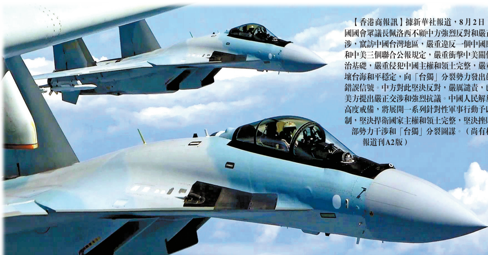
央視昨晚報道，解放軍蘇-35戰機穿越台灣海峽。

【香港商報訊】據新華社報道，8月2日，美國國會眾議院議長佩洛西不顧中方強烈反對和嚴正交涉，竄訪中國台灣地區，嚴重違反一個中國原則和中美三個聯合公報規定，嚴重衝擊中美關係政治基礎，嚴重侵犯中國主權和領土完整，嚴重破壞台海和平穩定，向「台獨」分裂勢力發出嚴重錯誤信號。中方對此堅決反對，嚴厲譴責，已向美方提出嚴正交涉和強烈抗議。中國人民解放軍高度戒備，將展開一系列針對性軍事行動予以反制，堅決捍衛國家主權和領土完整，堅決挫敗外部勢力干涉和「台獨」分裂圖謀。（尚有相關報道刊A2版）