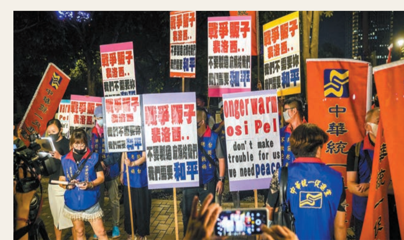
美眾議院議長佩洛西搭乘的C-40C專機昨晚22時43分左右降落在台北松山機場。圖爲台灣多個社會團體準備大量標語，前往其下榻的台北市信義區君悅酒店外抗議。

聲明最後敦促美方看清台灣問題的歷史經緯，認清兩岸同屬一個中國的事實和現狀，以實際行動恪守一個中國原則，履行中美三個聯合公報，不要在錯誤道路上越滑越遠。聲明最後正告民進黨當局，徹底放棄「台獨」圖謀，不要在「台獨」的死路上一條道走到黑。否則，任何謀「獨」行徑都將在中國人民反「獨」促統的強大力量下粉身碎骨。