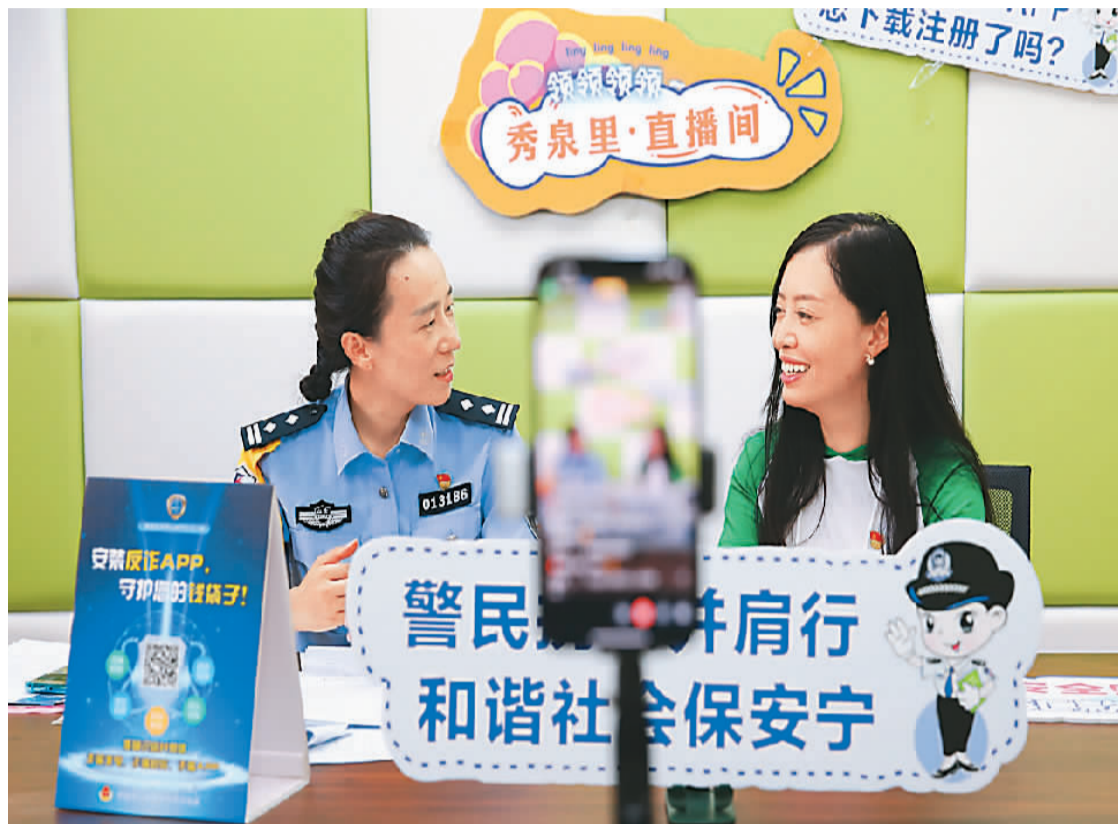
山东省济南市公安局市中分局刑警大队反诈一中队与十六里河派出所民警来到秀泉社区直播间,在社区书记配合下开展“线上”反诈宣传。

“女子当街遭陌生男子拖拽,路人制止致施暴者轻伤一级,要担责吗?”“去年我与一家教育机构签了培训协议,招生老师承诺保证让我拿到证书,结果我没考过,发现合同上也没写明这一条,这种行为属于欺诈吗?可以要求退款吗?”……登录司法部的智慧普法平台,各种普法知识跃然眼前,既有以案说法的法治新闻汇编,也有针对网友提问的精准解答,还有不少动漫、短视频形式的法律小知识,形成了网络普法的重要阵地。 司法部普法与依法治理局副局长杨金宇介绍,全国普法办建立智慧普法平台,整合6000多家新媒体,组成全国普法新媒体矩阵,每天推送信息数万条,这些内容受到网友的喜爱与点赞。近两年,司法部、全国普法办在全国持续开展“疫情防控、法治同行”专项行动,编