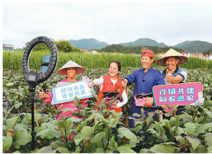
浙江省金华市开展“百镇共建”以来,义乌市苏溪镇和磐安县尚湖镇结对共建,解决农民的燃眉之急。图为苏溪镇青年委员通过直播带货+社区团购的模式销售尚湖镇茄子等农副产品。

民政部相关负责人表示,健全完善村级综合服务功能,是国家对村级服务首次系统性、完整性提出要求,对村当下需要哪些服务做出