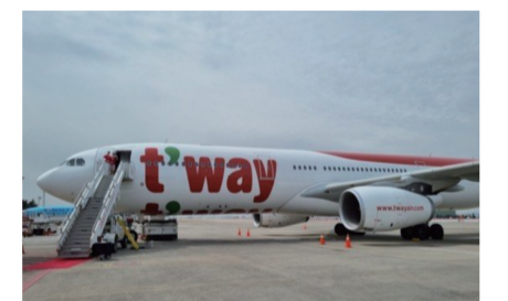
德威航空客機 (資料圖)

1.2日當天韓國德威航空一架A330-300客機在臺北機場緊急迫降，機上共有117名乘客和10名乘務員，該客機2日凌晨從新加坡起飛，原定前往韓國仁川。